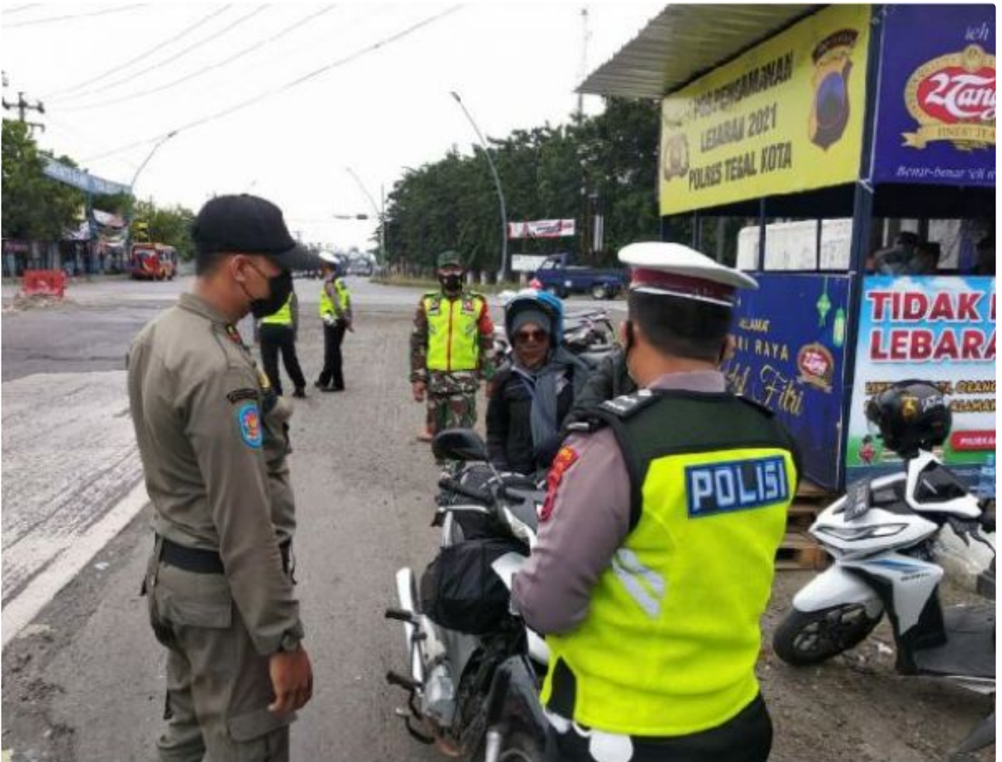
Tim Gabungan TNI/Polri, Satpol PP dan Petugas Kesehatan Dinkes Kota Tegal saat melakukan pemeriksaan terhadap Pengendara yang Masuk Kota Tegal. Sabtu (22/5/2021)

TEGAL - Operasi gabungan aparat TNI/Polri, Satpol PP dan Petugas kesehatan dari Dinas Kesehatan Kota Tegal kembali digelar dengan tingkat pemeriksaan yang lebih ketat dan difokuskan pada akses jalan pantura tepatnya di Pos